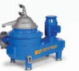
CENTRÍFUGAS DE DISCO