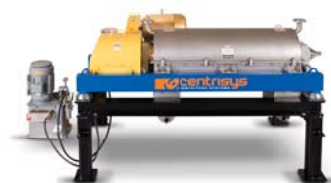
Centrífugas de Espessamento série THK