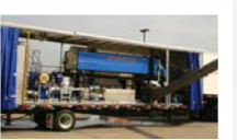
SISTEMAS DE REBOQUE